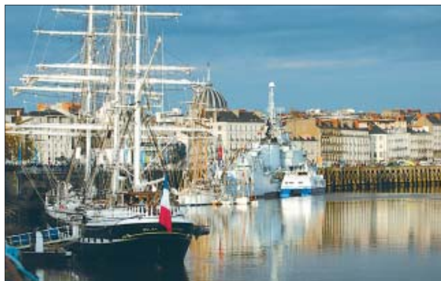
Die Passage Pommeray in Jules Vernes Heimatstadt Nantes gibt es noch, aber im Hafen liegen nur noch selten prächtige Segler wie die Belem.

◆ Anreise: Vom Pariser Flughafen mit dem TGV nach Nantes in drei Stunden, ab 35 Euro die einfache Fahrt. Von Amiens nach Nantes benötigt der TGV dreieinhalb Stunden (ab 40 Euro).